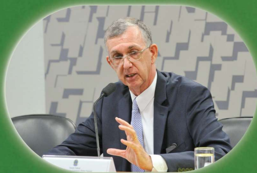
Sérgio França Danese, Embaixador do Brasil na África do Sul.

“Este Programa foi uma ferramenta para fomentar a nossa relação bilateral de forma muito concreta, como um exemplo das muitas possibilidades desta maravilhosa parceria sul-transatlântica em particular. Estamos muito orgulhosos e satisfeitos com os resultados. A embaixada do Brasil estende seus parabéns e agradecimentos a todos os participantes. Esperamos que essa seja a primeira de muitas iniciativas para um futuro promissor.”