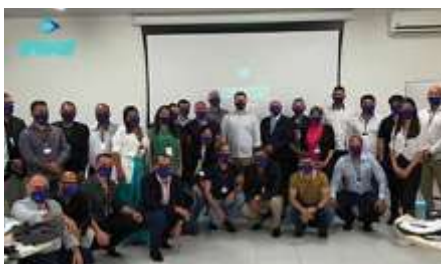
Participantes do evento Prefeitos do Futuro no tecnoPARQ UFV

O tecnoPARQ, graças ao seu trabalho intenso voltado para o desenvolvimento socioeconômico da nossa região, tem auxiliado também a gestão pública a ser mais inovadora e estratégica. Em 2021, o tecnoPARQ Social recebeu evento do Prefeitos do Futuro, que é o programa de desenvolvimento de prefeitos inovadores. A iniciativa já capacitou mais de 350 prefeitos em todo o Brasil, desde 2018.